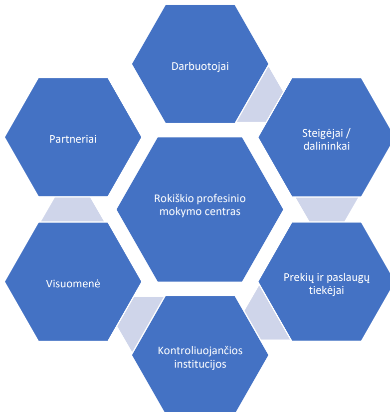
1 pav. Suinteresuotų šalių grupės

Centras yra nustatęs šias suinteresuotų šalių grupes (1 pav.):